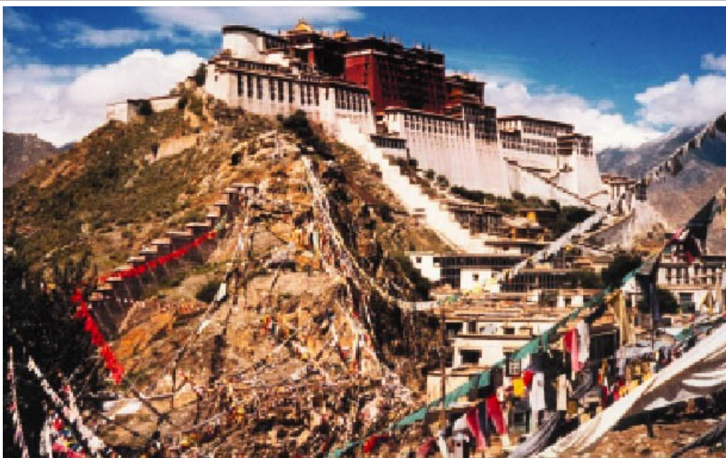
Der Potala auf dem Marpo-ri (= Roter Berg, 3800 m NN, Jurakalke) von Lhasa (Tibet). Blick vom Nordsporn des Chagpo-ri (= Eisenberg, 3750m NN, Jurakalke) auf den Hammelrücken des Potala (= roche moutonnée mit zahlreichen Gletschertöpfen und -schrammen). Edaphische Besiedlung aufgrund von Quellen, Mörtel und Baustoffen.

das Nationalbewusstsein zu eliminieren [3,4]. Früher geschah dies durch sehr lange Prozesse der Assimilation der Völker untereinander, wozu aber heute keine Zeit mehr bleibt. Eine Rückwendung zu alten humanistischen Werten und zu einer friedlichen Religiosität wäre daher erforderlich, um das Freund-Feind-Schema nicht mehr zuzulassen [5,6]. Durch eine Zunahme der Konfliktbereitschaft, der Aggressivität, der Kriminalität, des Drogenkonsums – bedingt durch Fehlerziehung in Elternhaus, Schule und Gesellschaft sowie die Probleme des Arbeitsmarktes, den Auswirkungen der inzwischen dramatischen Klimaverschiebung und eine erhöhte Bevölkerungsdichte (besonders Wohnsilos, Slums) – lässt sich in den vergangenen 50 Jahren eine Vervierfachung der Weltkonflikte (auch das Artensterben z. B. dem Niedergang der Insekten in Mitteleuropa zwischen 1950 und 2015 mit >95%, bedingt durch die zwischenzeitlich Chemie-betonte Landwirtschaft) beobachten [1, 9], so dass daraus erhebliche Flüchtlingsströme resultieren werden. „Wenn wir die Geopolitik nicht ändern, werden die Ärmern zu uns kommen“ (P. SCHOLL-LATOURE). Da alle Menschen auch von den Einwirkungen der ubiquitären Umweltgifte (zum Beispiel das Nervengift Tetraethyl-Blei in Treibstoffen von Ottomotoren oder Platinmetall-Emissionen der Autokatalysatoren neben anderen Luft- und Nahrungs-Schadstoffen) schleichend